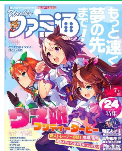
▲『週刊ファミ通』2021 年 4 月 15 日号表紙