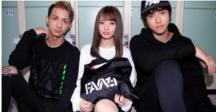
▲(写真左)GEOMETRIC LONG SLEEVE BLACK/SPLIT LOGO LONG SLEEVE WHITE size:M.L.XL ¥4,950[税込]