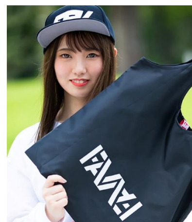
▲(写真左)EMBROIDERYHOODIE size:M.L.XL ¥6,930[税込]、(写真右)LOGO MARKET BAG ¥1,980[税込]